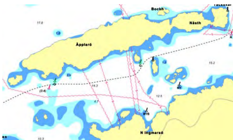
Sjökort ur Skippo-appen.